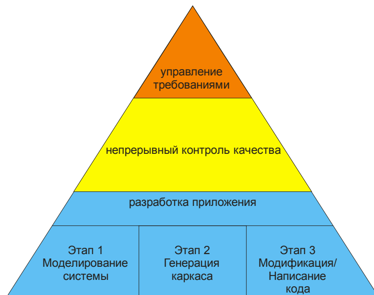
Рис. 3. Уровни i.Portal MSE

Преимуществом предлагаемого автором метода является его узкая ориентация на разработку приложений, служащих для представления данных организации в Интернет-среде, на базе системы i.Portal. За счёт этого у автора появилась возможность регламентации не только самого процесса разработки, но и используемых в нём инструментальных средств. Это, в свою очередь, позволило сократить время, необходимое для начала использования платформы и метода разработки для неё.