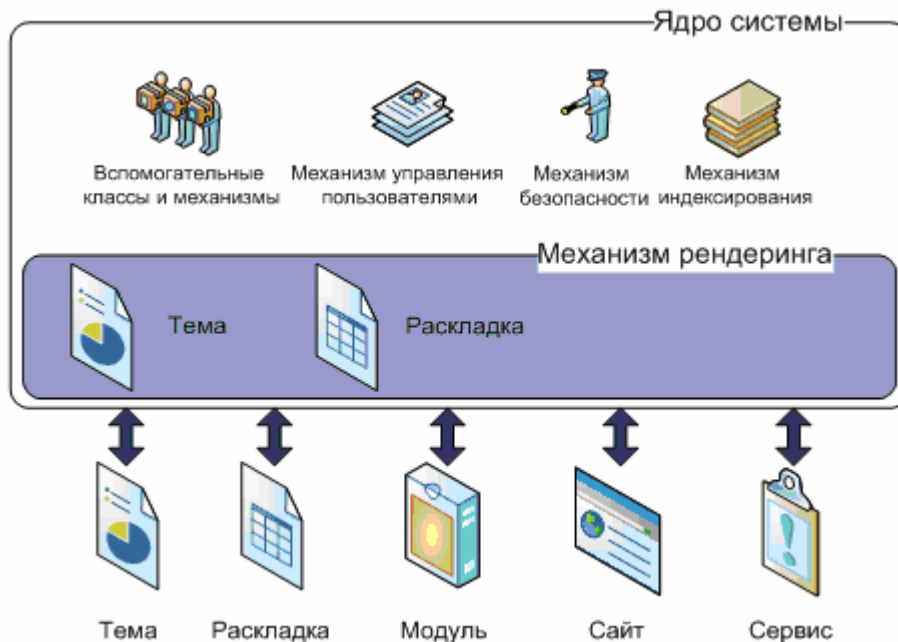
Рис. 1. Архитектура системы i.Portal

Укрупнённый вариант архитектуры системы приведён на рис. 1.